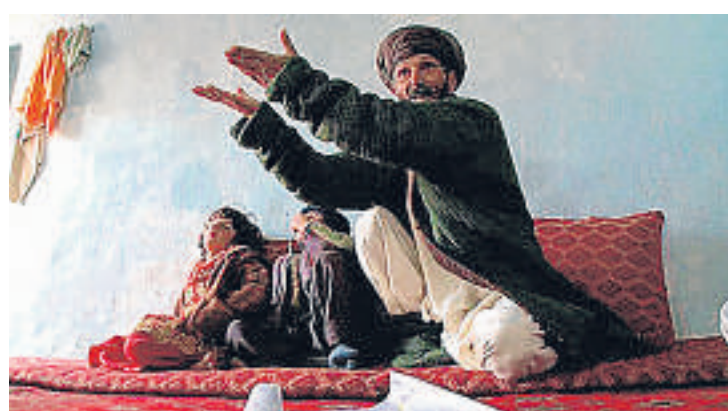
Ein Film wird gedreht (oben links), während ein junger Mann vor einem zerstörten Tanker wacht (unten links). Man träumt von schönen Dingen (oben rechts) und soll auf die Alten hören: Einblick in den Alltag einer Generation, die zwischen Taliban und ausländischem Militär aufwächst.